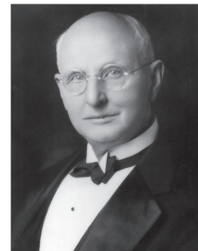
Dr. Weston A. Price 1870 – 1948

Neem voor meer informatie contact op met de Price-Pottenger Nutrition Foundation, die sinds 1952 de gedocumenteerde studies van dr. Price beheert en beschermt. De foto's en citaten zijn gebruikt met toestemming van de Price-Pottenger Nutrition Foundation, www.ppnf.org .