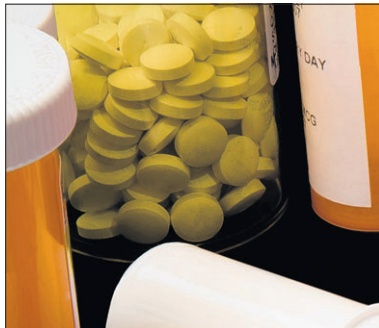
Veel pillen kennen volgens Virapen gevaarlijke bijwerkingen.

U zit al twintig jaar niet meer in de medicijnen. Komen die beschreven